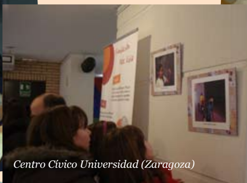
Centro Cívico Universidad (Zaragoza)