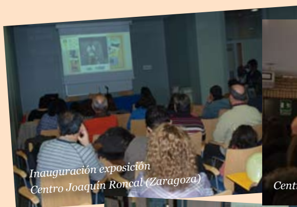
Inauguración exposición Centro Joaquín Roncal (Zaragoza)