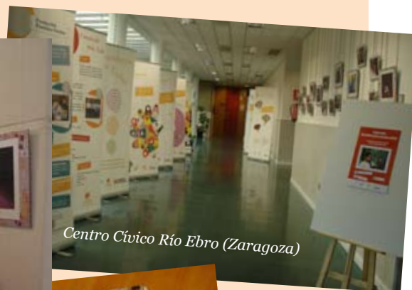
Centro Cívico Río Ebro (Zaragoza)