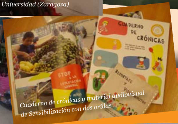
Cuaderno de crónicas y material audiovisual de Sensibilización con dos orillas